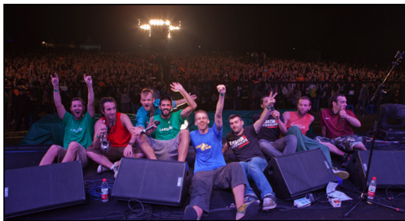
Xi'hu Festival (Hangzhou, China)