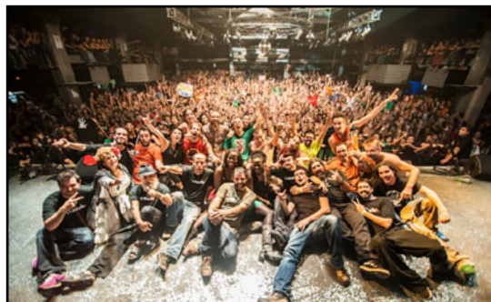
Razzmatazz (Barcelona, 2012)

El disco "Eureka!" se editará en diez países, entre los cuáles hay Argentina, Chile y Uruguay. El resto son España, Japón, Francia, Alemania, Bélgica, Holanda y Luxemburgo.